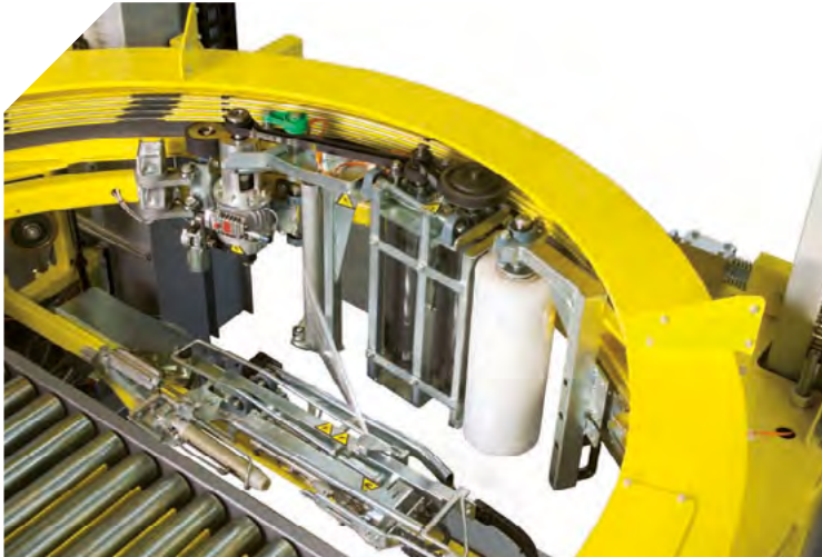
GRUPPO PRESTIRO FILM E GRUPPO PINZA DI TAGLIO FILM (BREVETTATO) FILM PRE-STRETCHING UNIT AND FILM INSERTION CLAMP UNIT (PATENTED) UKŁAD WSTĘPNEGO ROZCIĄGU FOLII STRETCH I UKŁAD ODCINANIA I ZACZEPIANIA KOŃCA FOLII (OPATENTOWANY) FOLIENVORRECKUNG UND FOLIENEINLEGZANGE (PATENT)

POSSIBILITA' DI DISPORRE DI UN MODELLO COMPLETO DI DOPPIO CARRELLO PORTABOBINA DENOMINATA "BIBOXTER" POSSIBILITY OF MAKING USE OF A MODEL COMPLETE WITH DOUBLE REEL-HOLDER CARRIAGE CALLED "BIBOXTER" MOŻLIWE WYKONANIE MODELU W PODWÓJNYM WÓZKIEM - MODEL BIBOXTER AUCH IN DER AUSFÜHRUNG "BIBOXTER" KOMPLETT MIT DOPPELTEM FOLIENWAGEN LIEFERBAR