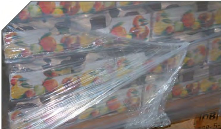
RISULTATO FINALE GRUPPO DI TAGLIO PINZA X-DEP END RESULT OF CUTTING FILM WITH X-DEP SYSTEM REZULTAT ZAKAŃCZANIA CYKLU OWIJANIA Z UŻYCIEM SYSTEMU X-DEP ENDERGERBNIS FOLIENENDSCHNITT MIT X-DEP