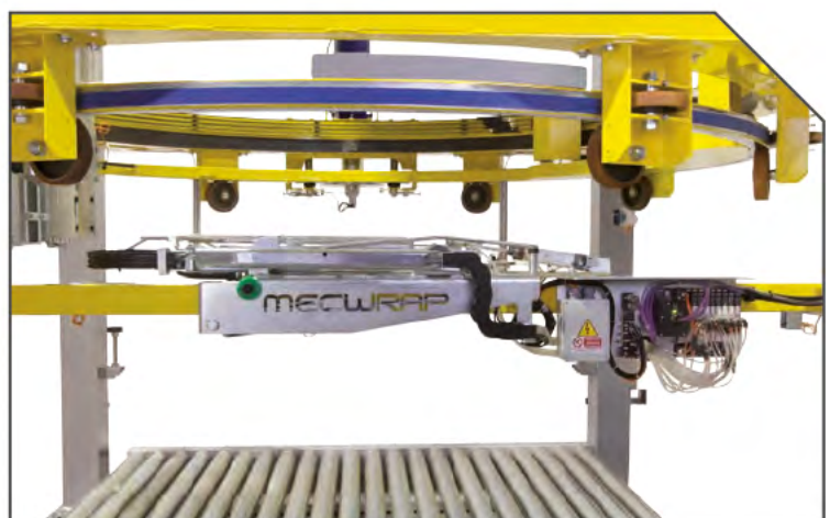
GRUPPO DI TAGLIO ED INFILAGGIO FILM MOD X-DEP (BREVETTATO) CUTTING AND CLAMPING UNIT MOD. X-DEP (PATENTED) UKŁAD ODCINANIA I ZACZEPIANIA KOŃCA FOLII MODEL X-DEP (OPATENTOWANY)PATENTIERTE VORRICHTUNG ZUM ABSCHNEIDEN UND EINLEGEN DES FOLIENENDES MODELL X-DEP